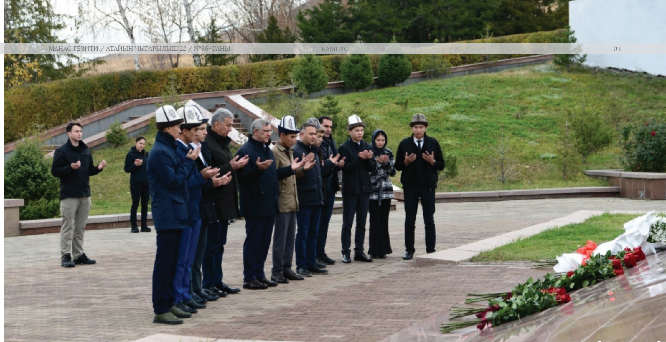
КАБАР: МЕДИАМАНАС