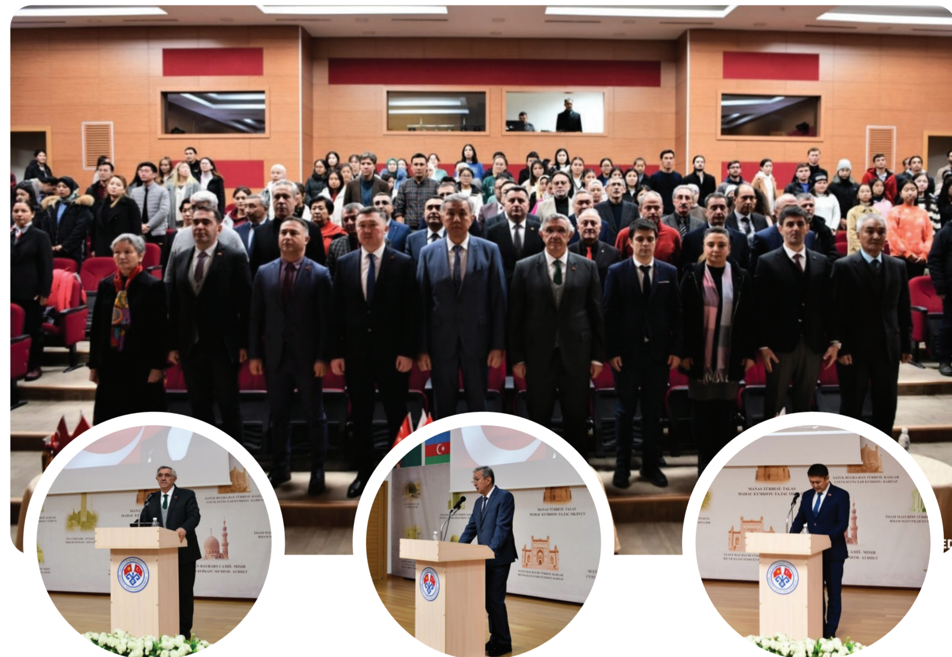
10 - ноябрь Түркия Республикасынын негиздөөчүсү жана биринчи президенти Мустафа Кемал Ататүрктүн дүйнөдөн кайткан күнү. Буга байланыштуу Кыргыз-Түрк “Манас” университетинде Ататүрктүн дүйнөдөн өткөнүнүн 84 жылдыгына арналган эскерүү иш-чарасы болуп өттү.

Иш-чара эртең менен Бишкектеги “Ататүрк” атындагы эс алуу паркында Мустафа Кемал Ататүрктүн эстелигинин астына гүл коюу менен башталды. Андан соң эскерүү университетте улантылып, ага окуу жайдын жетекчилери, академиялык жана административдик кызматкерлери жана студенттер катышты.